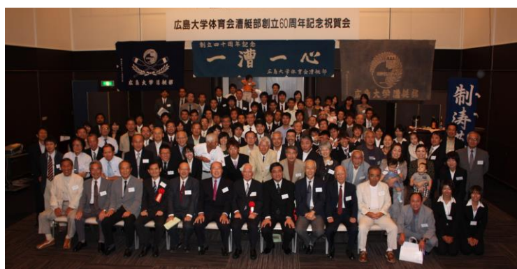
創部60周年祝賀会 2009年