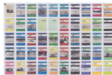
「みささ」50号50冊表紙一覧